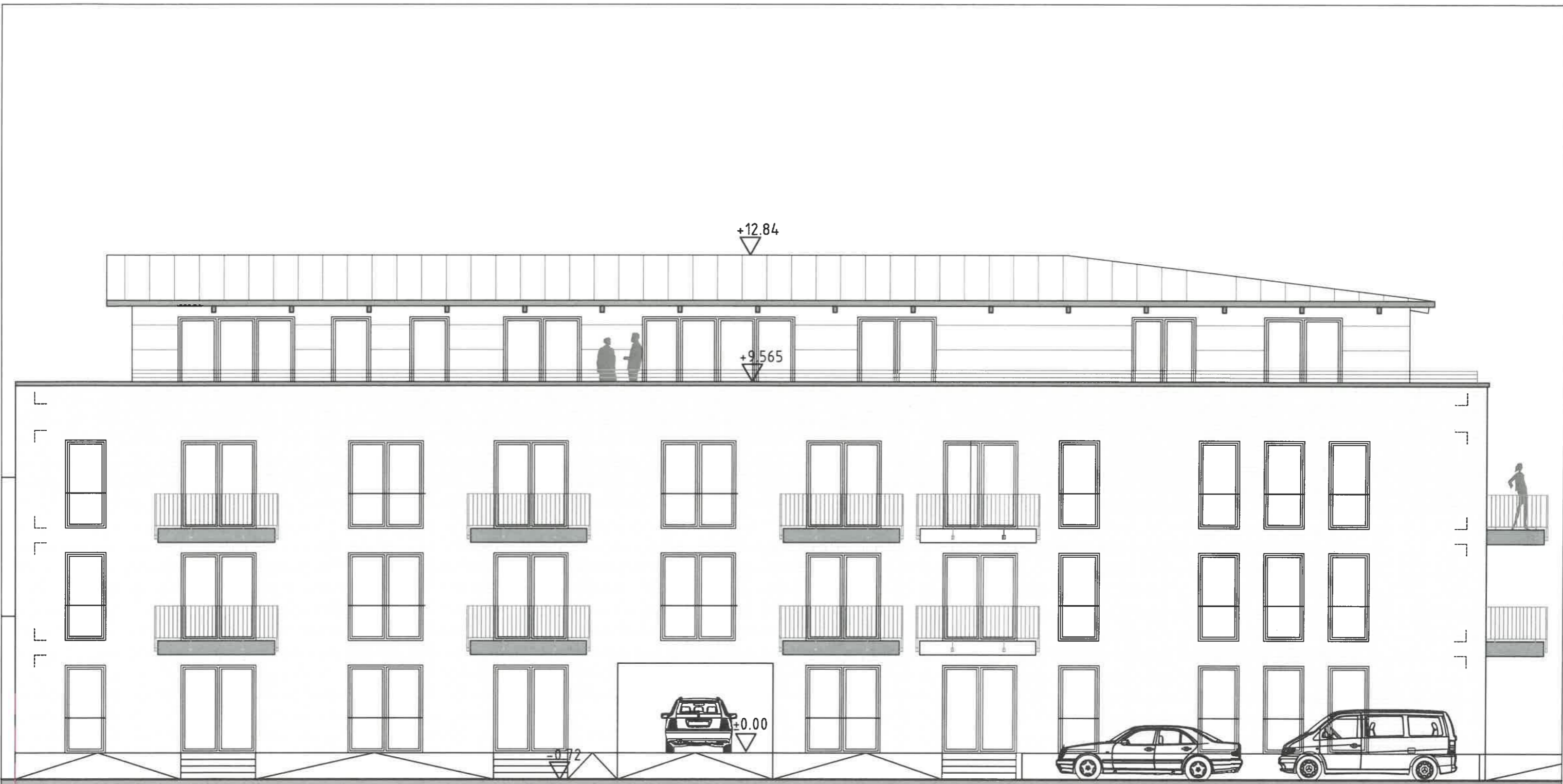
Ansicht Nord-West (Tegelkuhle)